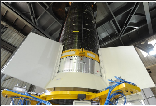
Integração Inerte do 1º Estágio VS50 na TMI