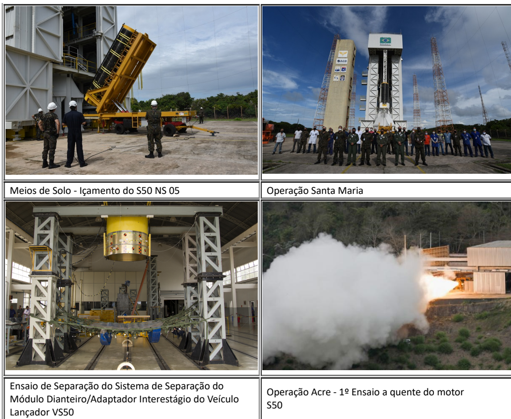
Meios de Solo - Içamento do S50 NS 05