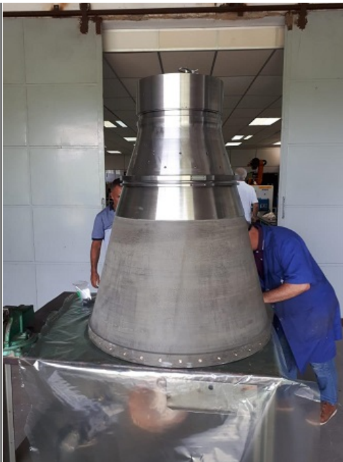
1ª Tubeira do S50 - Tiro em Banco