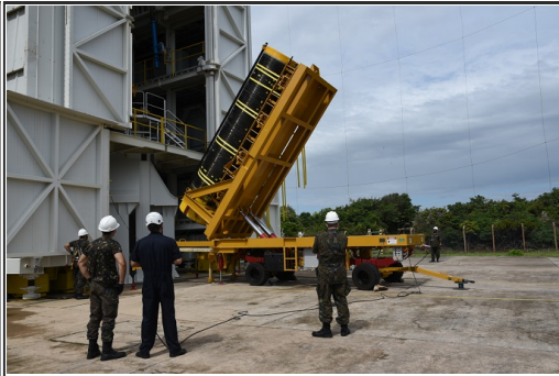
Meios de Solo - Carreta Industrial de Içamento S50