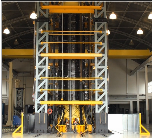
Ensaio Estrutural S50