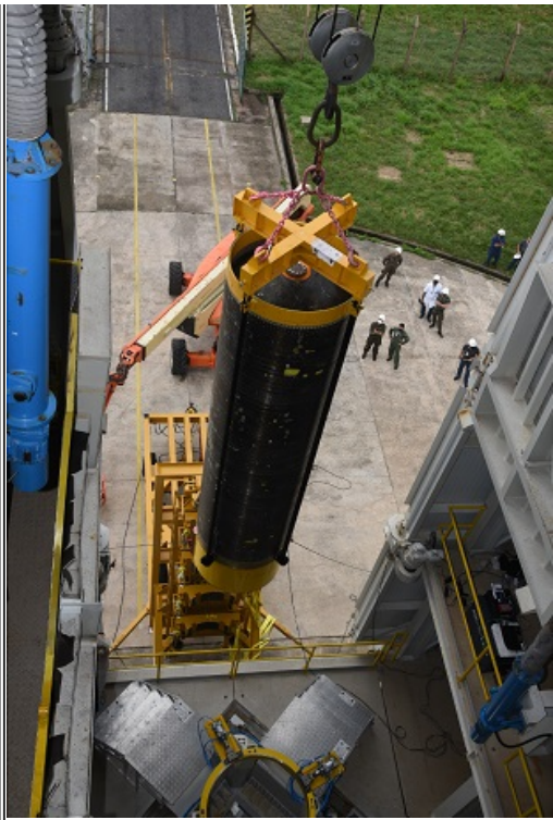
Meios de Solo - Içamento do S50 NS 02 Inerte na TMI do CLA