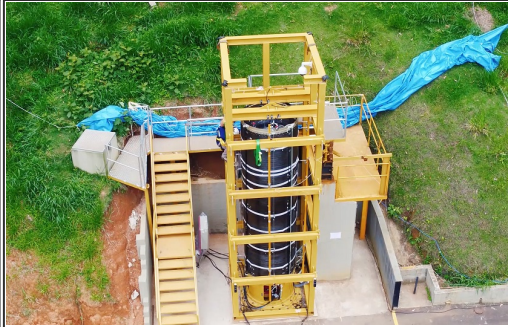
Ensaio de Ruptura do S50 NS 01