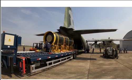
Embarque do S50 NS 02 no C-130